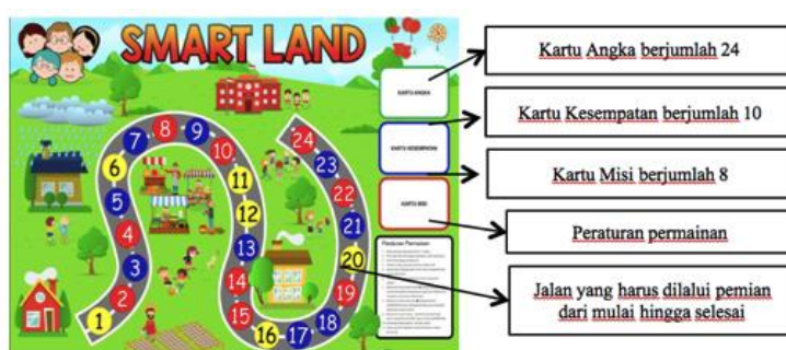
Gambar 1. Tampilan Board Game Smart Land

Tahap design dilakukan dengan membuat story board untuk menjelaskan garis besar permainan Smart Land yang akan dikembangkan. Story board menjelaskan secara runtut, dari tampilan board game , design kartu, puzzle , cara bermain dan aturan permainan pada media Smart Land . Setelah design selesai dibuat langkah kedua adalah implementasi dari story board ke dalam produk menggunakan aplikasi software CorelDraw X7 . Proses design disesuaikan dengan karakteristik anak Sekolah Dasar untuk tampilan dan juga gambar-gambar yang digunakan. Untuk aturan main dalam media game ini dikembangkan sesuai prinsip game oleh Bell (Limantara et al., 2015).