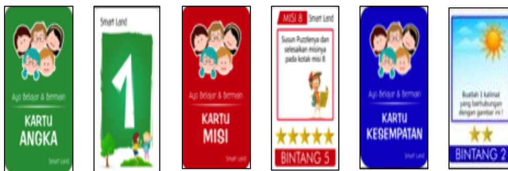
Gambar 3. Tampilan kartu media Smart Land

Media Smart Land memiliki 3 kartu yaitu kartu angka, kartu misi dan kartu kesempatan. masing-masing memiliki ketentuan. Kartu berwarna hijau adalah kartu nomer untuk menentukan kemana pemain akan berhenti, kartu berwarna merah adalah kartu misi untuk menentukan misi berapa yang mereka dapatkan. Kartu warna biru adalah kartu kesempatan kartu ini berisi pertanyaan yang harus dijawab oleh peserta didik.