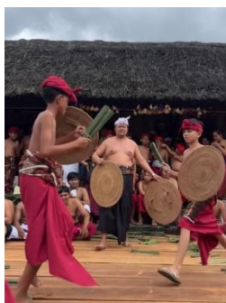
Gambar 1. Anak usia SD mengikuti tradisi Mageret Pandan

Peserta Mageret Pandan terdiri dari laki-laki dari berbagai kelompok usia, mulai dari anak-anak hingga dewasa. Berdasarkan hasil observasi, keterlibatan anak-anak usia sekolah dasar dalam Tradisi Mageret Pandan berlangsung secara bertahap dan terkontrol. Anak-anak terlibat ketika membantu persiapan arena hingga mengikuti pertarungan ringan dengan pengawasan orang dewasa. Anak-anak yang mengikuti pertarungan ini diatur lebih ringan dan aman. Keterlibatan ini menjadi proses belajar sosial yang penting untuk anak-anak dalam belajar memahami makna tradisi, nilai kebersamaan, dan rasa hormat terhadap leluhur.