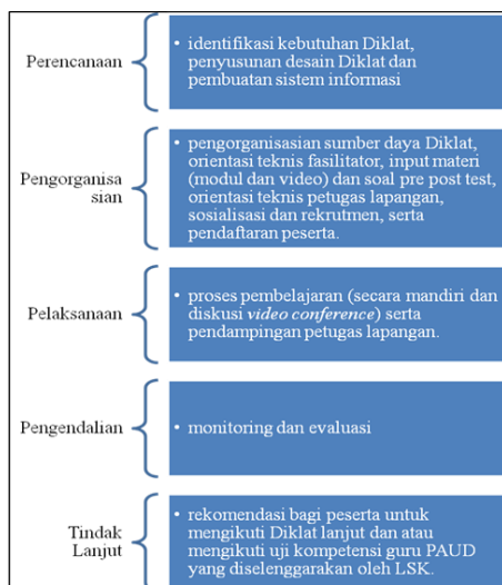
Gambar 2 Model Manajemen Diklat

Sedangkan model Manajemen diklatnya seperti gambar berikut: