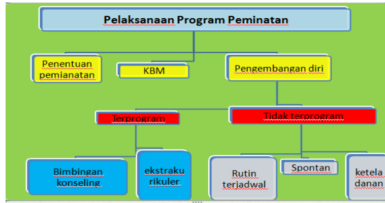
Gambar 3. Pelaksanaan Program Peminatan

berbagai pihak agar pelaksanaan kegiatan lebih optimal oleh kepala sekolah bersama-sama staf dan petugas yang terlibat secara integratif dan terencana melakukan tahapan yang direncanakan.