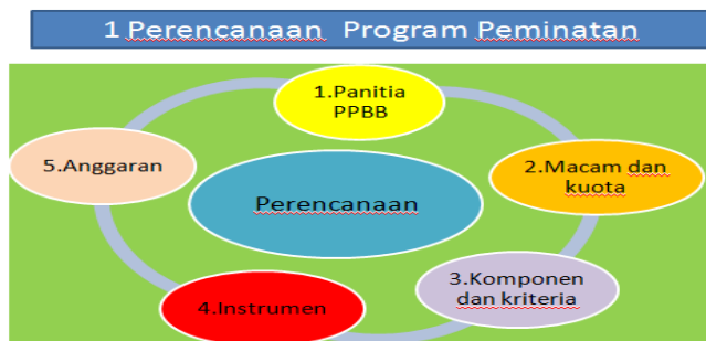
Gambar 1 Perencanaan Program Peminatan

Perencanaan program peminatan peserta didik dalam Kurikulum 2013, melalui kegiatan yang digambarkan sebagai berikut: