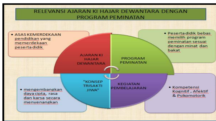
Gambar 5. Relevansi program peminatan dengan ajaran Ki Hajar Dewantara