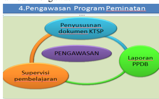
Gambar 4. Pengawasan program peminatan kurikulum 2013

Pembina melalui verifikasi jumlah jam pengajar yang dilaksanakan minimal 2 kali untuk setiap guru. Pengawas juga meneliti kelengkapan dokumen guru mata pelajaran sebagai berikut: program tahunan, program semester, rencana pelaksanaan pembelajaran (RPP), Laporan Pelaksanaan Harian/Agenda mengajar. Buku Presensi Siswa, Buku Kemajuan Kelas, Buku Nilai Ulangan Harian, Analisis Ketuntasan Ulangan Harian, Bukti Pembelajaran Remidi dan pengayaan. Kegiatan pengawasan secara singkat dapat dilihat dalam gambar 4 berikut: