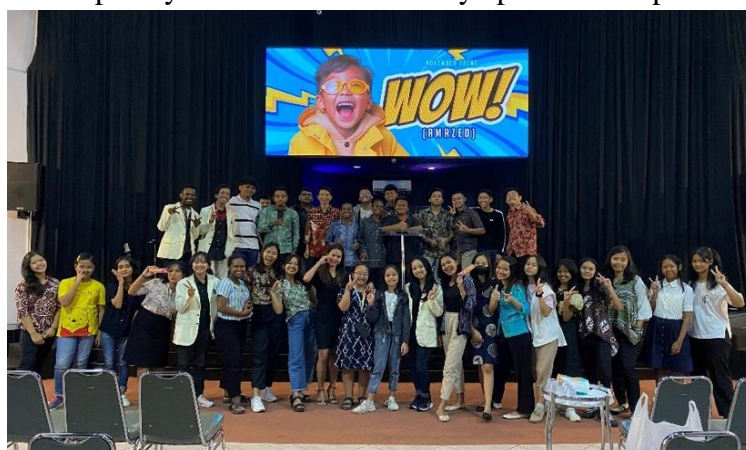
Gambar 3. Foto bersama mahasiswa dan peserta

Kegiatan Equipping Youth berjalan dengan lancar dan kondusif. Kegiatan ini dihadiri oleh 35 peserta dari Kingdom Generation . Peserta sangat antusias dengan materi yang dibawakan oleh masing-masing pembicara. Tidak hanya antusias dengan materi yang dibawakan saja, namun para peserta juga sangat antusias dengan Ice Breaking yang telah dipersiapkan. Setelah kegiatan Equipping Youth , para peserta mulai memahami pentingnya manajemen diri dan kepercayaan diri dan manfaatnya pada kehidupan sehari-hari.