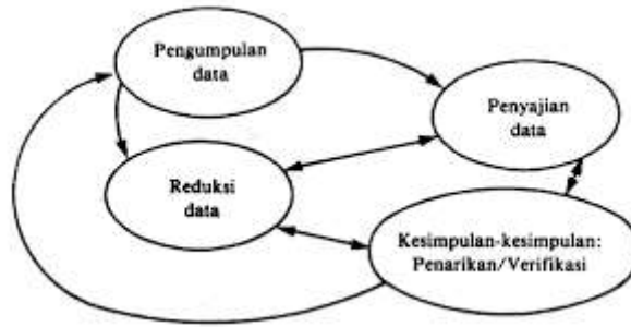
Gambar Teknik Analisis Data Model Miles and Huberman