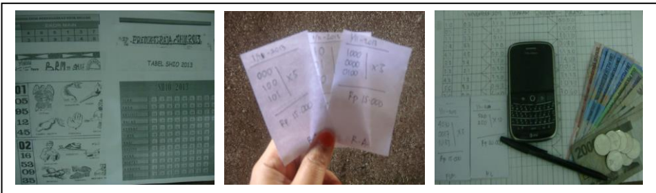
Gambar 2 Sarana Perjudian Pada Perjudian Togel

penghasilannya pun tidak berkenan di hadapan Tuhan untuk digunakan. Namun ada pula yang menerimanya karena sudah menjadi kebiasaan